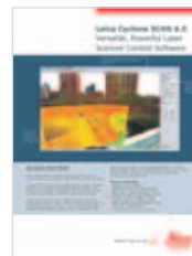
Leica Cyclone SCAN Informazioni sul prodotto