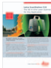
Leica ScanStation C10 Informazioni sul prodotto e dati tecnici