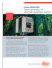
Leica HDS6200 Informazioni sul prodotto e dati tecnici