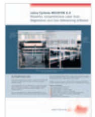
Leica Cyclone REGISTER Informazioni sul prodotto